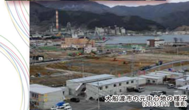
大船渡市の元中心地の様子 (2013/3/11 撮影)