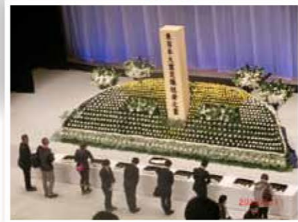
追悼式の様子(大船渡市 リアスホール)↑

巨大地震に伴う大津波と放射能汚染による最悪の被害となった東日本大震災は11日、発生から4年を迎えました。あの日を思い起こさせるような強い風が吹き、時折雪も舞う中、各地で追悼行事が行われました。大船渡市では、市主催の追悼式が行われ、市民ら約600人が参列しました。県内の死者は5,122人、行方不明者は1,129人。約2万8千人が未だ仮設住宅での生活を強いられています。亡くなられた方々の無念を無駄にしないために、1日も早い復旧・復興を成し遂げる事をお祈りいたします。