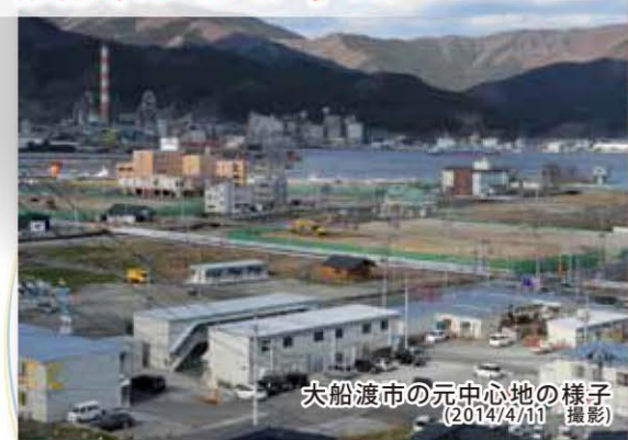
大船渡市の元中心地の様子 (2014/4/11 撮影)