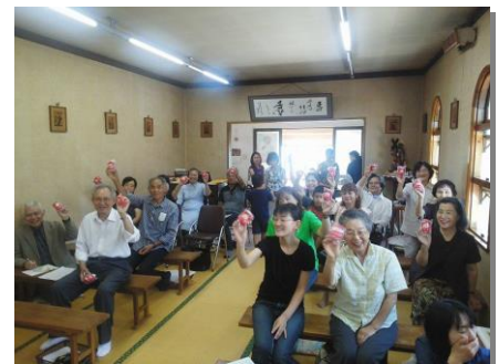
無料で配られた「おおふなトン」に喜ぶ大船渡教会の方々

大船渡市の公認キャラクターのため、幾つかの制限はあったが、吉田さんの丁寧な細部調整のおかげで、9月に無事製作が完了した。この製作費は大阪教区の皆さまから ENGO プロジェクトに頂いた募金から拠出。現地では教会や幼稚園関係者には無料で配布され手に取った方々は癒しのグッズとして大変喜ばれた。