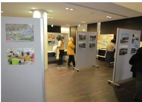
各方面からパネル貸し出しの依頼が殺到。ENGO の啓蒙活動の一端を担った。

ENGO は陰ながらそれらの活動を支え、応援してきているとともに、今も被災地の視察を通して、正しい現状を確認し、いつでも皆さんにその状況を伝えられるよう準備をしています。そして、これからも継続してその活動は続けていかなければならないと、改めて被災地を訪れて感じています。ただし、今まで通りではなく、この3年半