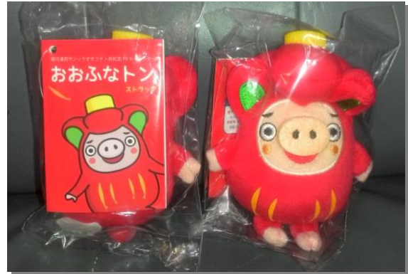
フェルトでできた手のひらサイズの「おおふなトン」